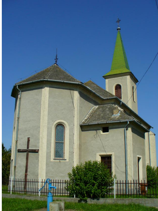
A nagykamondi ktolikus templon