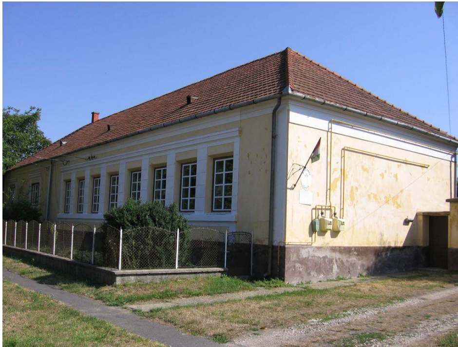
Az iskola épülete